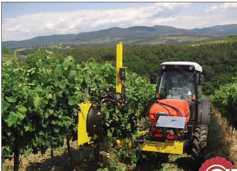
Lavorazione con attrezzatura orientata a destra