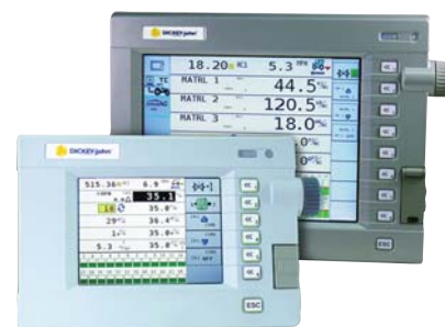
DICKEY-john Virtual Terminal

Prima applicazione al mondo mai realizzata in Rateo Variabile, sviluppata in partnership con Marchesi Antinori e Same Deutz Fahr (elettroniche a bordo trattore) questa macchina utilizza il nuovo standard di comunicazione elettronica ISOBUS e può essere quindi governata da un trattore già dotato di monitor virtuale acquisibile in prima fornitura con il trattore SAME (i-Monitor) oppure con il terminale virtuale DICKEY-john da noi distribuito ed applicabile a qualunque tipo di trattore. Questo terminale è in grado di gestire anche tutte le altre applicazioni ISOBUS in generale ed in particolare il concimatore VRT di nostra produzione con un sensibile abbattimento dei costi di acquisto. La nostra sfogliatrice è stata realizzata in modo da poter regolare il numero di foglie asportate sulla scorta di una mappa di prescrizione in base alla quale nelle varie zone prescelte si potrà avere sfogliatura elevata, sfogliatura moderata ed assenza totale di sfogliatura per le zone a più basso vigore vegetativo. Si tratta di una macchina rivoluzionaria che per prima avvicina il suo lavoro a quello della operazione manuale ove l'operatore (con un dispendio di 40 - 80 ore/ha contro 2 - 3 ore/ha della operazione condotta meccanicamente) sceglie le foglie da togliere soprattutto in funzione della più o meno eccessiva copertura dei grappoli. Per utilizzare questa macchina occorre mappare la vigoria del vigneto e generarne la mappa di prescrizione in termini di kg/ha di foglie asportate.