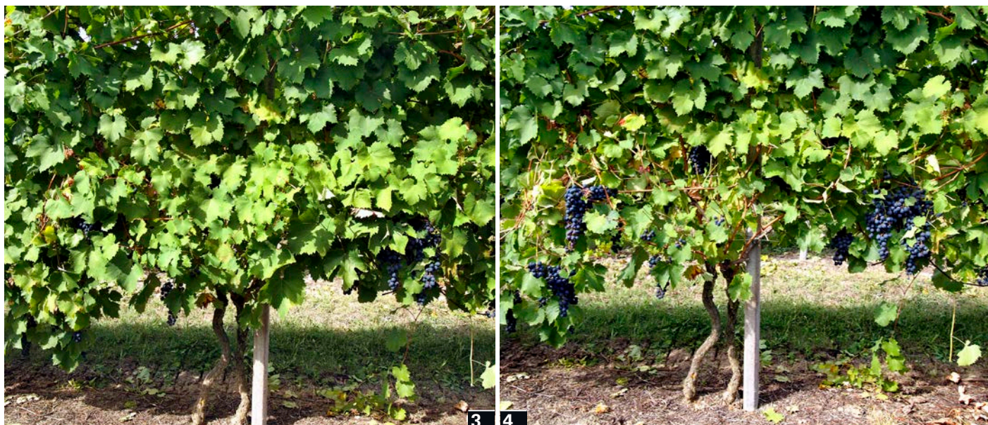
L'asportazione di foglie con la defogliazione a 200 giri/min, con trattrice alla velocità di 2,0 km/ora, è pari a 0,844 t/ha. Nelle foto i filari prima (3) e dopo (4) l'intervento

L'altezza di lavoro risulta pari a quella dei 2 rulli controrotanti (530 mm). La macchina presenta una regolazione idraulica della posizione della testata,