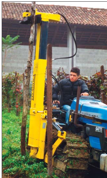
Estirpo vecchio palo