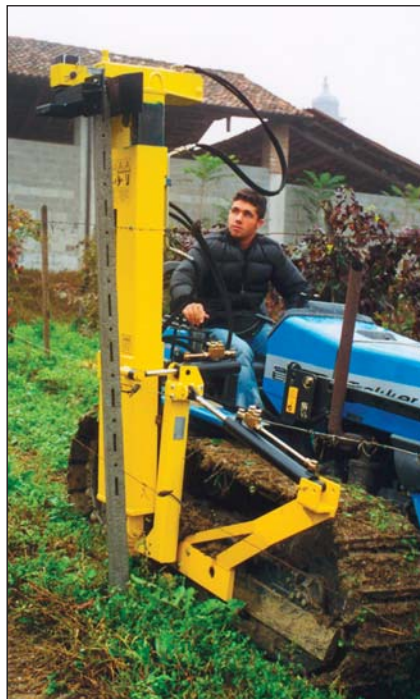
Inserimento nuovo palo mediante pinza