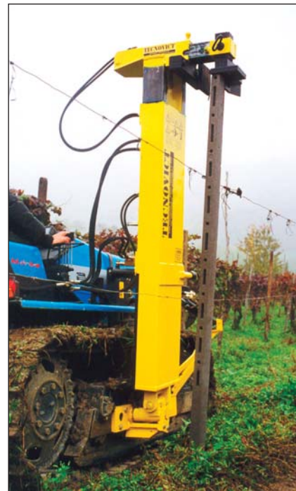
Inserimento nuovo palo mediante cappello di pressata