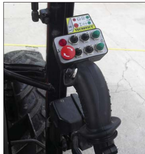
Comandi elettroidraulici con joystick