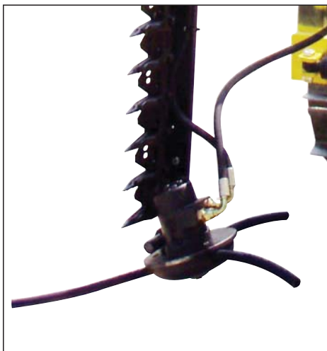
Convogliatore per germogli ricadenti