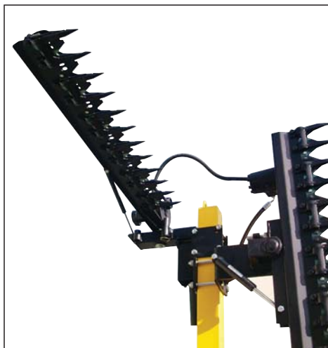
Topping a barra falciante cm. 80